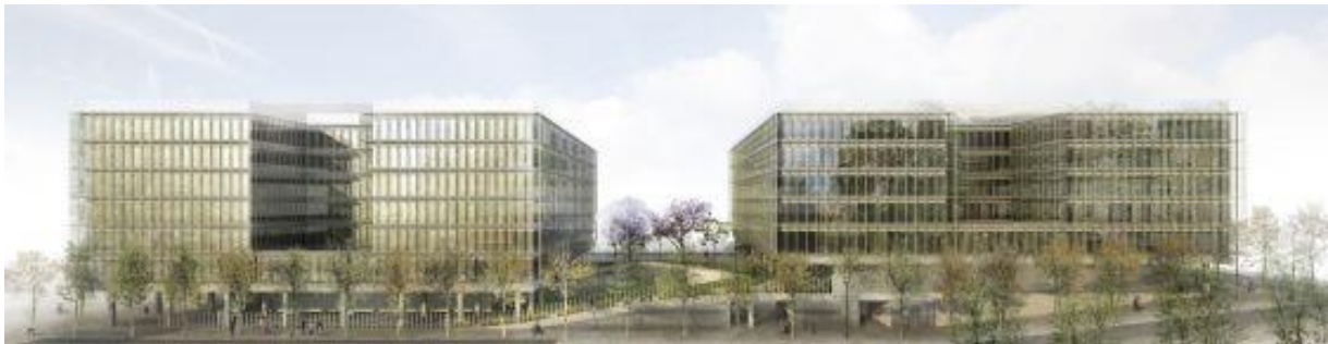
Nou Districte Administratiu (DA) a la Zona Franca de Barcelona