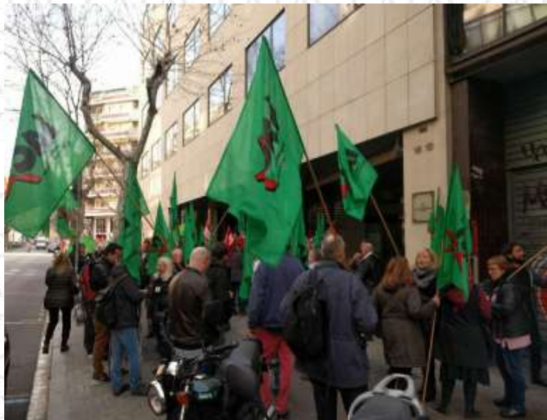
Concentració de delegats a la porta d’on se celebrava la Mesa General

Aquí, el que hi ha és un incompliment, per part del Govern de la Generalitat de les Resolucions del Parlament de Catalunya.